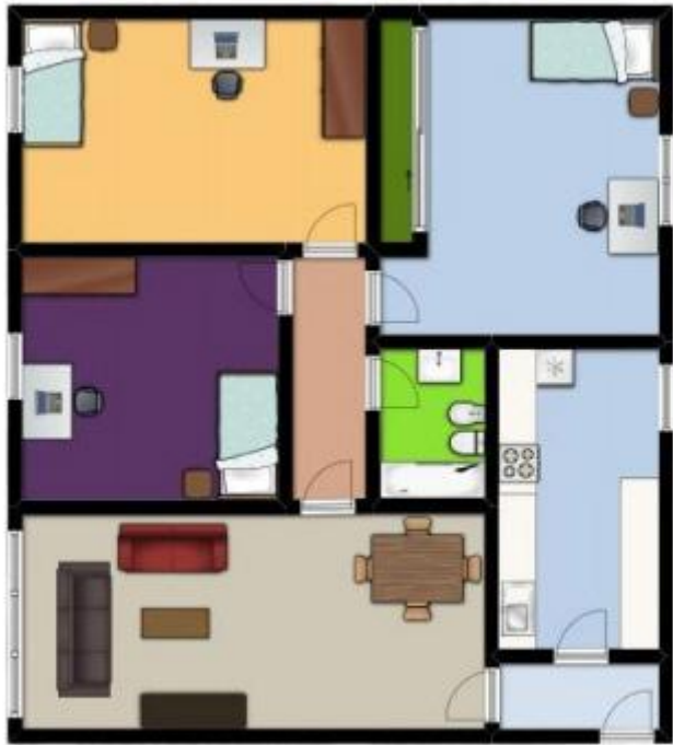
Plano de distribución de la vivienda